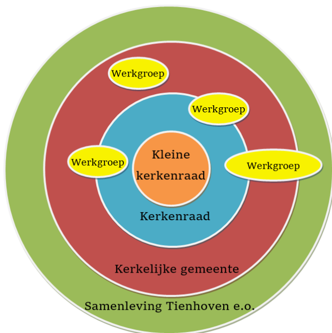
Organigram kerkelijke organisatie

Links ziet u een organigram van de organisatie van onze kerkelijke gemeente, zoals we die komende jaren willen gaan vormgeven. Met een kleine kerkenraad als kern (dagelijks bestuur), een kerkenraad die de hoofdlijnen uitzet en werkt aan levensbeschouwelijke verdieping, ingebed in de brede kerkelijke gemeente, die weer ingebed is in de samenleving van Tienhoven.